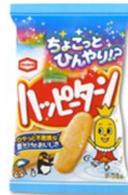
▲亀田製菓 ひんやりハッピーターン