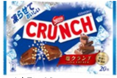
▲クランチ ミニ 凍らせておいしい 塩クランチ