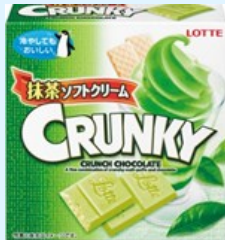
▲クランキー<抹茶ソフトクリーム>