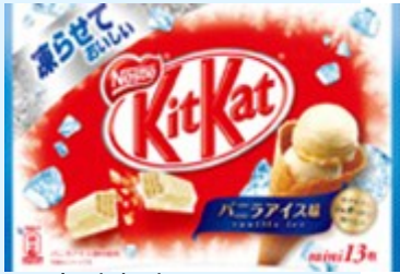
▲キットカット ミニ 凍らせておいしい バニラアイス味

ネスレ日本株式会社からは「冷やす」のさらに上に行く「凍らせておいしいチョコレート」シリーズが6月25日から発売された。