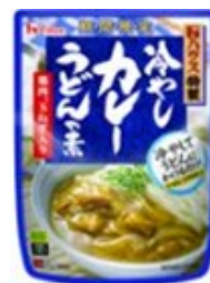
▲冷しカレーうどんの素

温めないでそのままごはんにかける だけでおいしい「夏のカレー」と冷たい 麺にかけるだけの「冷やしカレーうどん の素」が夏の期間限定で発売され た。