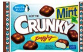
▲クランキーポップジョイ<ミント>