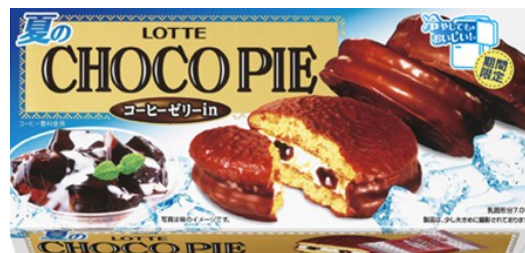
▲夏のチョコパイ<コーヒーゼリーin>