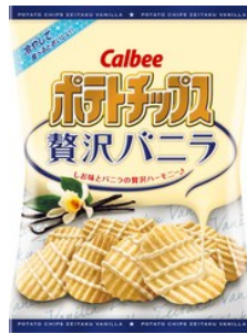
▲カルビー ポテトチップス贅沢バニラ