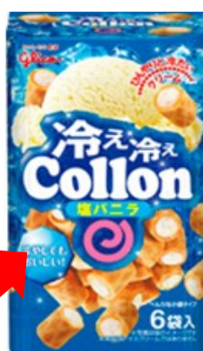
▲冷え冷えコロ ＜塩バニラ＞