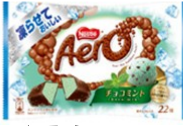
▲エアロ ミニ 凍らせておいしい チョコミント