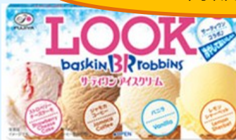
▲ルック(サーティワン)