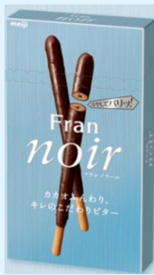
▲明治 フランワール