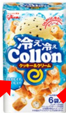
▲冷え冷えコロ ＜クッキー & クリーム＞