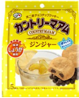
▲カントリーマアム ジンジャー