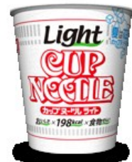
▲カップヌードルライト