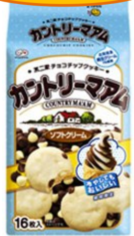
▲カントリーマアム (ソフトクリーム)