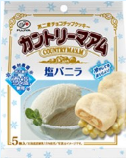
▲カントリーマアム 塩バニラ(雪塩)