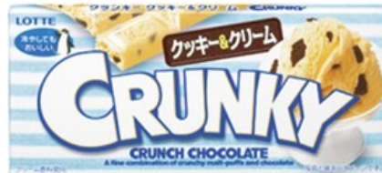
▲クランキー<クッキー&クリーム>