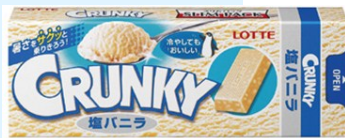
▲クランキー<塩バニラ>