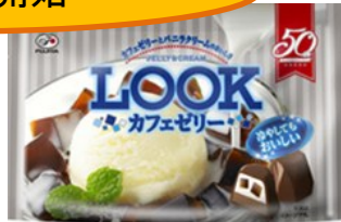
▲ルック(カフェゼリー)