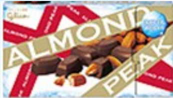
▲アーモンドピーク ＜氷デザインパッケージ＞

「ポッキー」シリーズからは、「ポッキーチョコレート」「ポッキー極細」「ポッキーソルティー」の三商品が「冷やしてもおいしい」をアピールした夏の新パッケージで6月12日から発売された。また「アーモンドピーク」も5月22日から氷デザインパッケージでの発売が開始された。いずれの新パッケージにも「冷やしてもおいしい」のロゴが入っている。