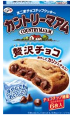
▲カントリーマアム 贅沢チョコ