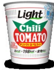
▲カップヌードル チリトマトヌードル ライト

「夏はICEで！カップヌードルライト」 というキャッチフレーズでカップヌードルの新 たな食べ方が提案されている。